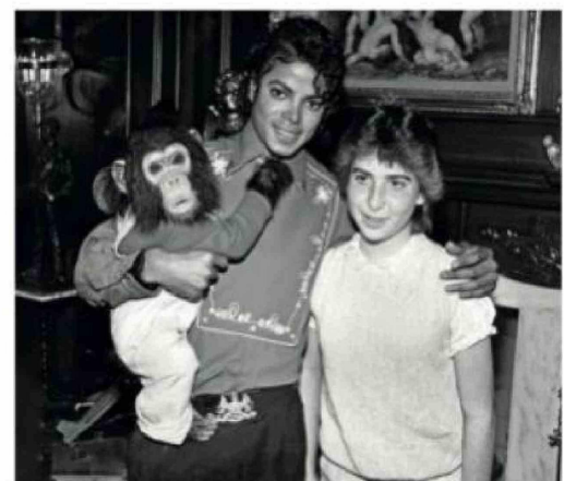
Michael Jackson con su chimpancé "Bubbles" y una fan.