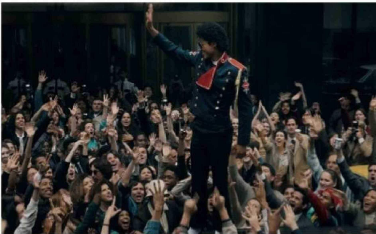
Michael Jackson ha logrado un repunte en su popularidad gracias a su nueva película biográfica.

bamos a más cosas, como besos, sexo oral, y él me decía que eso era un vínculo especial que teníamos y me decía cosas como: 'Sólo hago esto contigo', o 'Te quiero muchísimo'. Y hacía muchas cosas para demostrármelo. Ya sabes, algunas de las cosas que hacía eran... bebía mi orina y me decía: 'Esto es lo mucho que te quiero'".