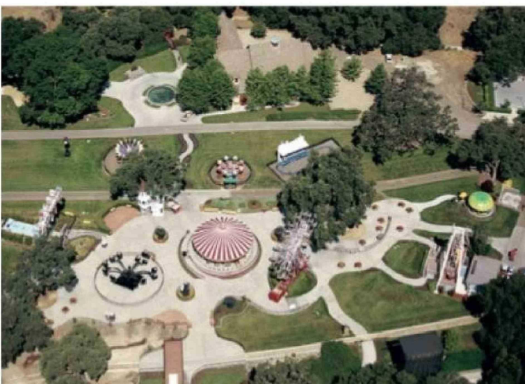
En Neverland, Michael Jackson organizó eventos benéficos y recibió a miles de niños y admiradores de todo el mundo.