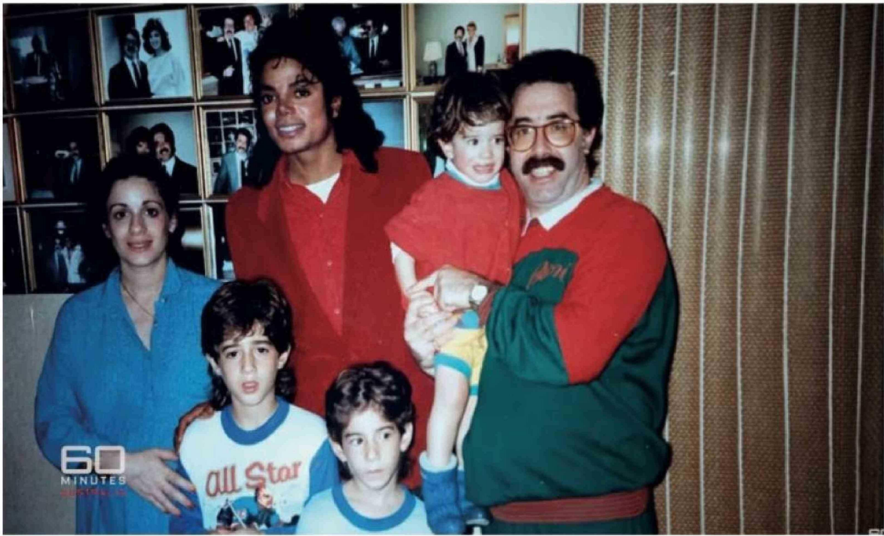
Los hermanos Cascio revelaron inquietantes detalles de la relación que tuvieron con Michael Jackson durante su infancia.