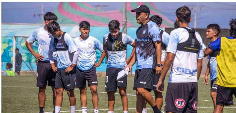
Rossi dijo que "Se han hecho reformas en el club, principalmente en el fútbol formativo porque queremos tener la mayor cantidad de jugadores formados en casa".

Finalmente, en la parte final de la entrevista, Rossi se refirió también a la rama femenina del club, donde también se están haciendo esfuerzos para contar con un buen plantel, para lo cual junto al cuerpo técnico han posibilitado la llegada de nuevas jugadoras al equipo.