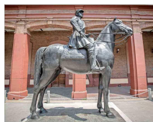
TRASLADO.— En marzo de 2021 se renovó el monumento del general Baquedano. Hoy se encuentra en el Museo Histórico y Militar.

Consejo fue inútil frente al incendio de la iglesia de la Veracruz, que en ese momento, la iglesia de San Francisco de San Borja, la sede de la Universidad Pedro de Valdivia; le importó