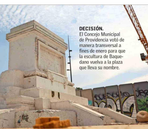
DECISIÓN.— El Concejo Municipal de Providencia votó de manera transversal a fines de enero para que la escultura de Baquedano vuelva a la plaza que lleva su nombre.

nada. Tuvo una actitud absolutamente condescendiente y complaciente, incluso". A su juicio, en el caso del monumento al general Baquedano, "el acuerdo que