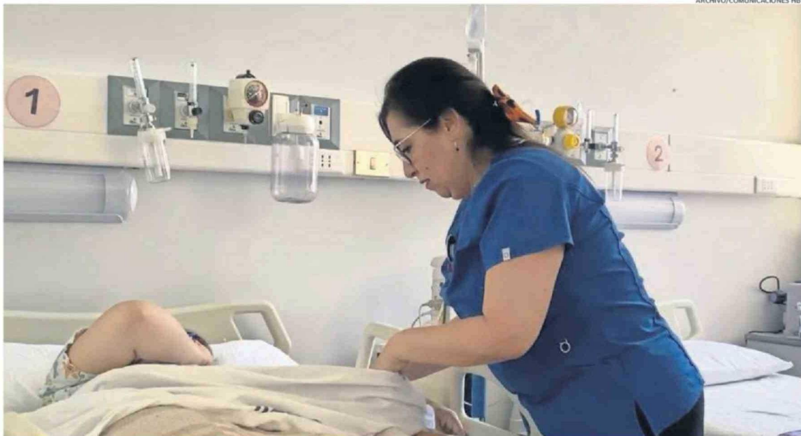
LA SITUACIÓN DE PACIENTES ABANDONADOS GENERA UNA PRESIÓN IMPORTANTE SOBRE LA DISPONIBILIDAD DE CAMAS HOSPITALARIAS Y SOBRE LA CAPACIDAD OPERATIVA DE LA RED.

Con respecto al trato y atención que se entrega a este tipo de pacientes, el directivo del Servicio de Salud Los Ríos afirmó que: "Estos pacientes continúan recibiendo atención integral y digna dentro de nuestros establecimientos de salud. Aunque ya no requieren manejo clínico, mantienen de igual manera las prestaciones de sa-