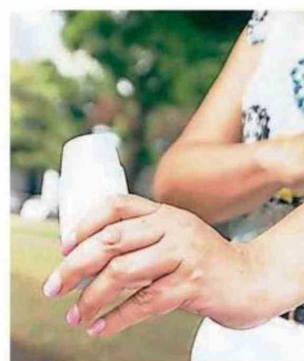
SE PRONOSTICAN 36° PARA LA REGIÓN.