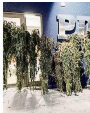
ORGANIZACIÓN APROVECHABA CONDICION

Clínica Dental Municipal, donde nosotros vamos a destinar las horas correspondientes para las urgencias dentales espontáneas entre 08:00 y 11:00 horas, y después de las 11:00 horas se realizarán atenciones a cuidadoras y cuidadores, además de los adultos mayores. De esta manera, podremos organizar la agenda correspondiente, aprovechando este beneficio que implementa el municipio en pos de la comunidad”, dijo.