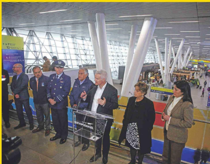
Autoridades hicieron el anuncio en el mismo AMB.

Además, existirá una zona donde se instalarán generadores de energía a partir de