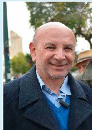
El senador y presidente de la Comisión de Energía del Senado, Juan Luis Castro informó que unos 100 mil hogares se han adjudicado al primer subsidio.

Sobre las pérdidas registradas a los usuarios durante los cortes del servicio eléctrico, el senador Castro aclaró que, la empresa CGE ha ofrecido un mecanismo en base a una cantidad de dinero por reclamación de pérdida de alimentos y medicamentos, por el orden de los 34 mil pesos, pero que es evidente, hay gente que perdió mucho más y tiene que hacer ver el monto acreditable de esa pérdida.