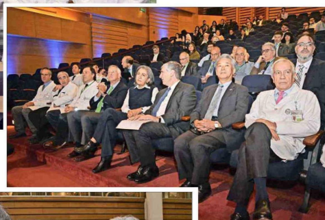
Autoridades y asistentes durante la inauguración del simposio.