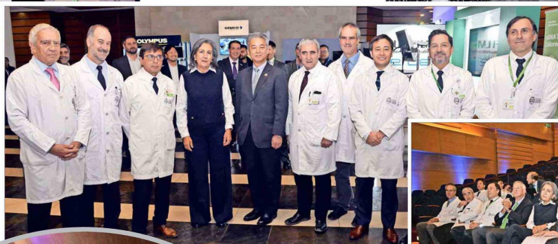
Equipo médico de Clínica UAndes junto a May Chomali, ministra de Salud, y Kenko Sone, embajador de Japón.