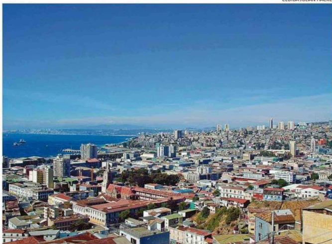
VALPARAÍSO ES LA REGIÓN CON MÁS DÉFICIT FUERA DE LA REGIÓN METROPOLITANA.

A nivel local, la noticia positiva es la disminución del 14% en el déficit respecto a la medición de