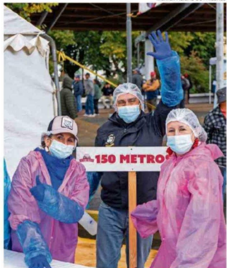
MUNICIPALIDAD DE PAILLACO