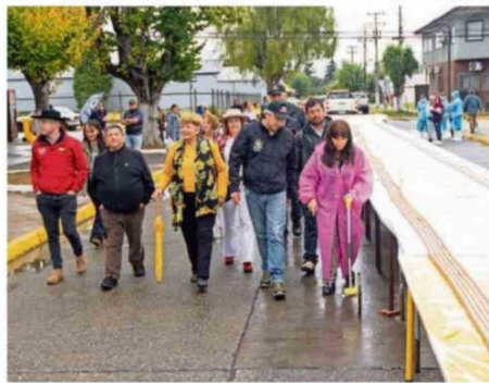
MUNICIPALIDAD DE PAILLACO