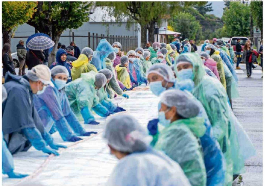
MUNICIPALIDAD DE PAILLACO