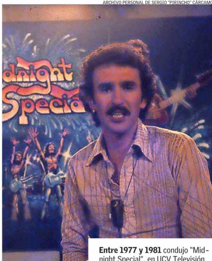
Entre 1977 y 1981 condujo "Midnight Special", en UCV Televisión.

el resto de mis compañeros. Sí, el rock se va reciclando a sí mismo y siempre aparece alguna novedad".