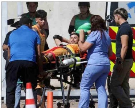
Su hijo Bastión se fue junto a él en la ambulancia.

ció más en el capítulo junto a su hijo, que lo acompañó. Este martes en el reality, Binza volverá solo al encierro en Calera de Tango y comunicará a sus compañeros que su padre "está hospitalizado. Le están haciendo exá-