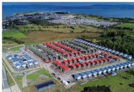
EN AGOSTO DEL 2024 LAS FAMILIAS ACCEDIERON A SUS CASAS.

cuidar sus viviendas, a cuidar sus barrios, a hacer ciudad, que es a lo que el Ministerio de Vivienda los invita en cada uno de los procesos de postulación que ofrece a la comunidad", concluyó. ☺