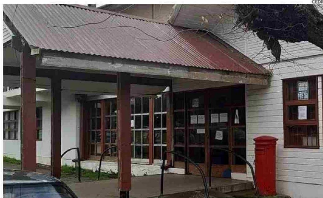
LA ACTUAL ADMINISTRACIÓN PLANEA DEFINIR LINEAMIENTOS QUE LLEVEN A DISMINUIR LAS DEUDAS POR AGUA.

de Puerto Octay se califica como rural, por lo que mantiene sus propios sistemas y la planta abastece sólo a quienes viven en el sector urbano.