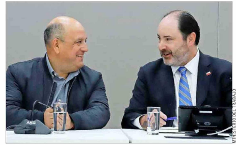
El presidente de la CUT, José Manuel Díaz, y el ministro del Trabajo, Tomás Rau, sostuvieron un primer encuentro protocolar el 24 de marzo.

multisindical, José Manuel Díaz, indicó que "queremos llegar a la mesa (con el Gobierno) con datos actualizados y una propuesta que realmente responda a la realidad que están viviendo los trabajadores". Demandó que esperan que