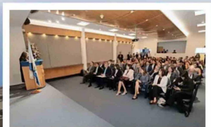
Ceremonia de inauguración año académico 2026.