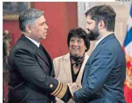
AYER EL PRESIDENTE BORIC RECIBIÓ AL NUEVO COMANDANTE EN JEFE.