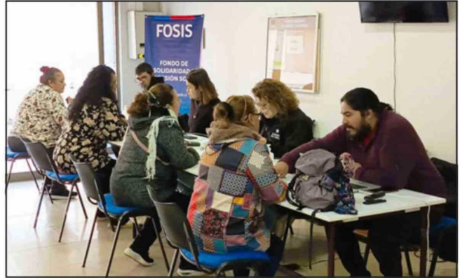
Fosis abre más de tres mil cupos para emprender en la Región de Valparaíso.