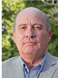
Jorge Quiroz será el nuevo ministro de Hacienda.