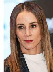
Mara Sedini será la ministra vocera de Gobierno.