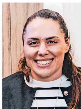
Natalia Ducó llegaría al Ministerio del Deporte.