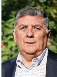
Claudio Alvarado (UDI) será el próximo ministro del Interior.