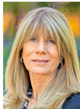
Ximena Rincón (Demócratas) podría asumir en la cartera de Energía.