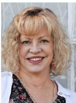
Catalina Parot se haría cargo de Bienes Nacionales.