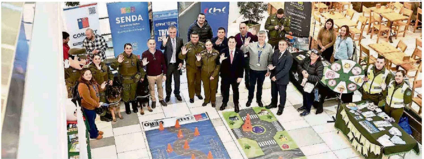
AUTORIDADES REGIONALES PARTICIPARON EN LA PRIMERA FERIA DE SEGURIDAD VIAL REALIZADA EN ÑUBLE.

Título: Ñuble realizó su primera Feria de Seguridad Vial