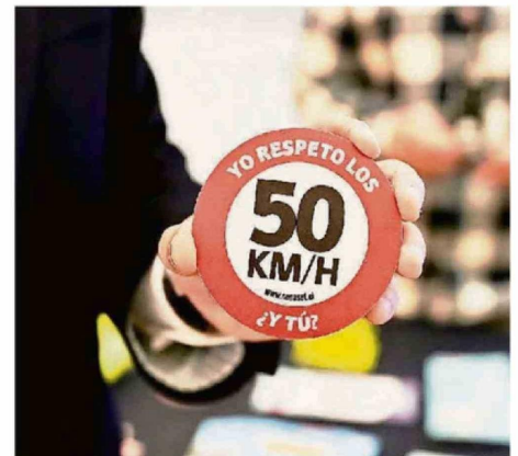
LA FERIA BUSCÓ FORTALECER LA CONCIENCIA VIAL Y PROMOVER EL AUTOCUIDADO ENTRE LA CIUDADANÍA.