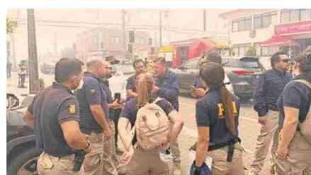
La Fiscalía instruyó a la PDI diligencias en sitios del suceso y a Carabineros el resguardo de estos como parte de la investigación.

de Penco, otros en terreno, a personal de la unidad de víctimas y testigos desplegada con nosotros acá y además en el Servicio Médico Legal (SML)". La persecutora indicó que se está trabajando en tres líneas: la primera es la instrucción de un equipo policial específico de la PDI en los sitios del suceso; también acompañar a los Laboratorios de Carabineros y de la PDI en el levantamiento de los 18 cadáveres (17 de la población Ríos de Chile en Lirquén y uno en Punta de Parra) y la eventual identificación inmediata o toma de datos para avanzar en ese proceso; así como el apoyo a las víctimas "que son muchas hoy y también en ese sentido tenemos un equipo multidisciplinario apoyando acá en Penco y al SML".