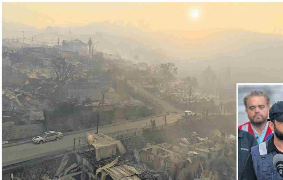
El voraz incendio Trinitarias que inició en Concepción arrasó poblaciones y villas completas en el sector de Lirquén en la noche del sábado 17 de enero.

Con los incendios activos y un complejo proceso de control, Boric recordó que la primera prioridad es el combate y extinción del