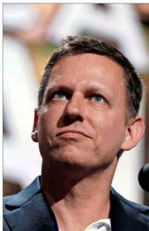
THIEL es uno de sus más antiguos aliados "tech" de Trump.