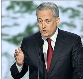
SACKS (en la foto de arriba) será el "zar" de las criptomonedas.