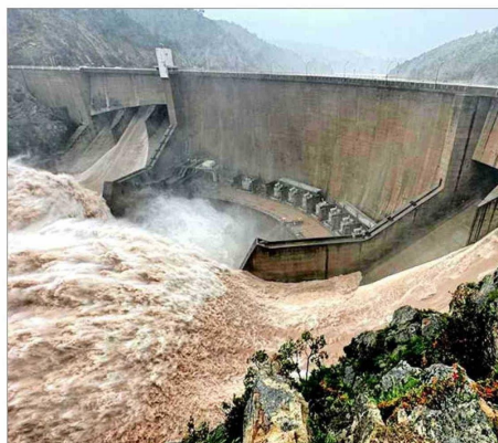
Las centrales hidroeléctricas son claves para la estabilidad y seguridad del sistema eléctrico.

Para este año, se espera poca disponibilidad de agua para la generación hidroeléctrica. Según información del Coordinador Eléctrico Nacional a noviembre, el promedio de exce-