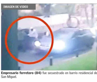
Empresario ferretero (84) fue secuestrado en barrio residencial de San Miguel.

tras que en el caso de Estación se trata de dos chilenos y dos venezolanos. Tras la audiencia, el fiscal Tapia comentó tras la formalización respecto de los imputados "que luego de los alegatos, donde se expusieron los elementos probatorios, se acredita la participación en los delitos, la forma en como ocurrieron estos hechos, a través de los elementos exhibidos". Entre ellos, detalló, "imágenes de cámaras de seguridad, análisis de teléfono, posicionamiento de antenas, interceptaciones telefónicas, entre otros. Pero también respecto de algunos antecedentes entregados por testigos que fueron bastante útiles para poder dar con el lugar de cautiverio y poder rescatar, lo más importante, a la víctima". Y agregó que "luego de todos estos antecedentes se decretó la prisión preventiva para todos los imputados e internación provisoria (para el adolescente)". Preocupa ante la policía y expertos la eventual reactivación de este fenómeno, luego que las últimas estadísticas de la fiscalía dieran cuenta de que era un delito que iba a la baja, al menos en los primeros meses de este año, en comparación con 2025.