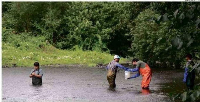
LAS MEDICIONES SE HACEN, FRECUENTEMENTE, DURANTE LAS CUATRO ESTACIONES DEL AÑO.

"El olor a veces es muy leve, pero comparado con lo que teníamos antes, la diferencia es notoria, y eso también habla de que la calidad ha ido mejorando", sostuvo.