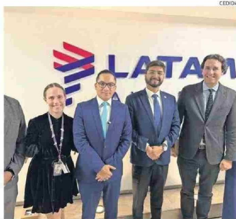
PARTICIPANTES DE LA MESA DE TRABAJO PÚBLICO-PRIVADA.

zona norte vía aérea debe ser una prioridad.