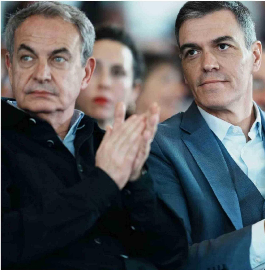
► El ex primer ministro español José Luis Rodríguez Zapatero junto al actual primer ministro Pedro Sánchez.

El exjefe del Ejecutivo socialista fue citado a declarar el próximo 2 de junio, acusado de organización criminal, tráfico de influencias y falsedad documental. “El tinglado se desmorona y los capos de la trama empiezan a caer”, proclamaron desde el opositor Partido Popular.