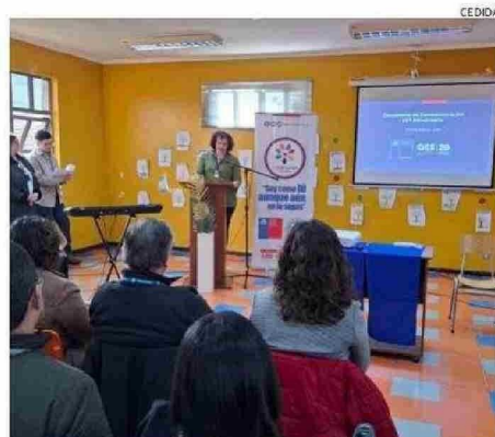
LA CEREMONIA SE REALIZÓ EN EL COSAM DE RAHUE.