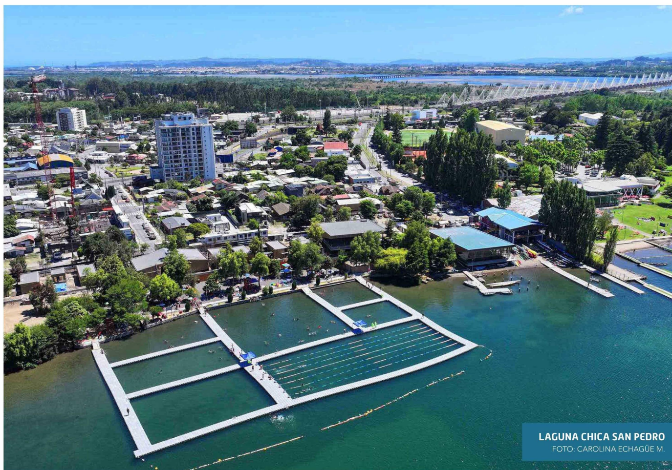
LAGUNA CHICA SAN PEDRO