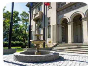
Jardín Pileta: El networking más exclusivo al aire libre.

Inscriba el próximo hito de su empresa en el escenario que su liderazgo merece.