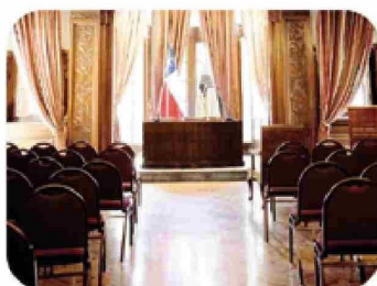
Salón Adolfo Ibáñez: Versatilidad y estilo.