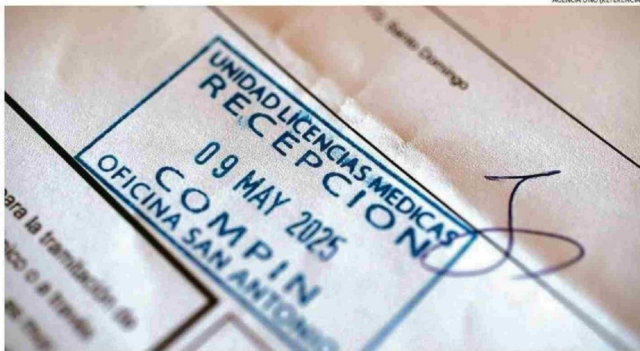
MÁS DE 25 MIL FUNCIONARIOS PÚBLICOS VIAJARON FUERA DEL PAÍS MIENTRAS GOZABAN DE LICENCIAS MÉDICAS.

En la comuna vecina de Valparaíso, en tanto, sí entregaron antecedentes. En ese