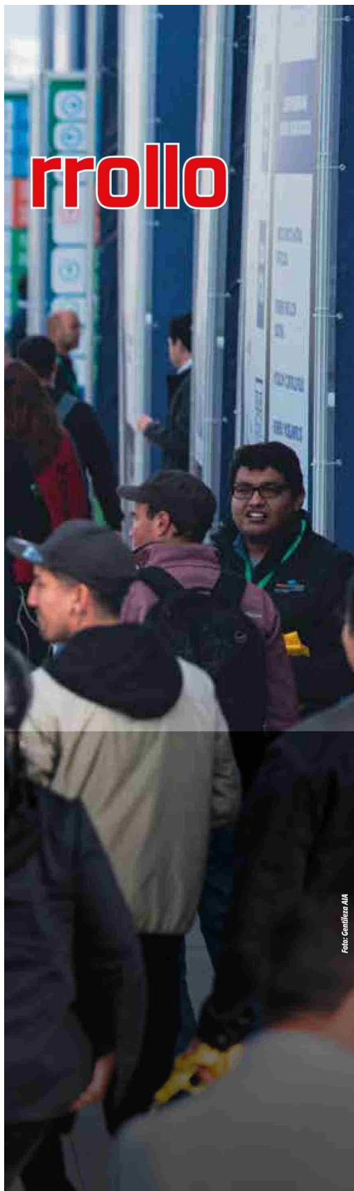
Para Exponor 2026 se proyecta la llegada de más de 47.000 visitantes.