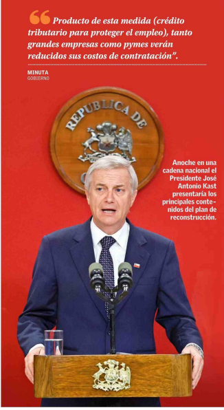
Añoche en una cadena nacional el Presidente José Antonio Kast presentaría los principales contenidos del plan de reconstrucción.

Crédito para proteger el empleo Una de las principales propuestas del plan, que ha sido más destacada por el ministro de Hacienda, Jorge Quiroga, es la creación de un crédito tributario, por concepto de pago de remuneraciones que vayan entre las 7,8 UTM ($545 mil) y las 12 UTM ($838 mil). En el Gobierno detallan que el beneficio será equivalente a un 15% para remuneraciones de 7,8 UTM y disminuirá progresivamente hasta llegar a un 0% de crédito para las remuneraciones que superen las 12 UTM. "Producto de esta medida, tanto grandes empresas como Pymes verán reducidos sus costos de contratación", señala una minuta del Ejecutivo. También enfatizan que este beneficio permitirá "una rebaja relevante" en la tributación de los contribuyentes del régimen Pyme, pasando de tributar con una tasa mediana de 12,5% del impuesto de Primera Categoría a un 7,8%. Se estima que este crédito beneficiará a más de 4 millones de trabajadores, de los cuales casi dos millones son empleados de empresas acogidas al régimen Pyme, y tendrá un costo fiscal anual de US$ 1.400 millones. En la rebaja del tributo que pagan las grandes empresas, se estableció una tasa única en régimen de 23%. Este descenso partirá recién en 2027 para las rentas percibidas en ese ejercicio comercial, bajando la carga de 27% a 25,5%; en 2028 caerá a 24%; y en 2029 llegará a 23%. "La reducción del impuesto (cor-