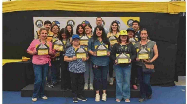
Un grupo de maestras participando en una feria regional de Sodimac.

"Con esta iniciativa queremos visibilizar historias reales de mujeres que se abrieron camino en una industria donde aún persisten