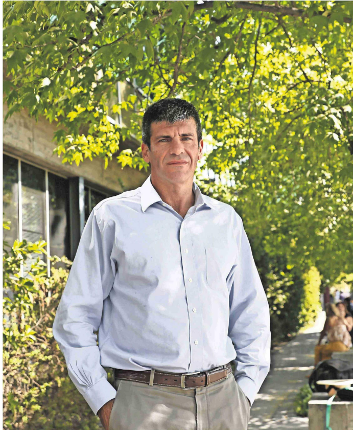
El abogado y exfiscal Gonzalo Yuseff Quirós analiza el caso de Ronald Ojeda.

Inicialmente se informó que se indagaba una operación de la inteligencia venezolana, un autosecuestro para perderle la pista al régimen de Maduro o un