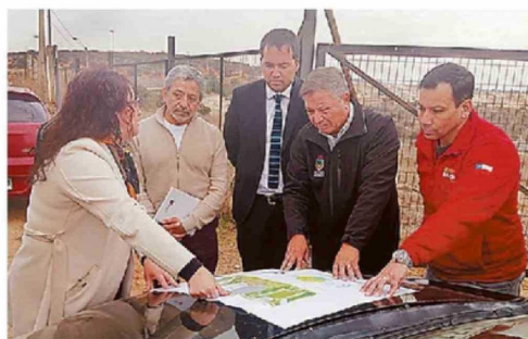
SE REALIZÓ UNA VISITA A LOS TERRENOS DONDE SE CONSTRUIRÁ.