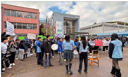
RECLAMO. — Luego de la manifestación pacífica, los alumnos del Instituto Superior de Comercio (Insuco) retornaron con normalidad a sus clases.