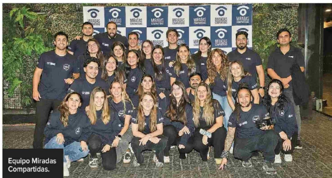
Equipo Miradas Compartidas.