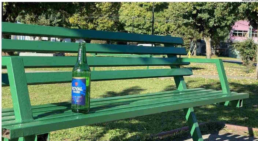
EN LAS MAÑANAS ES COMÚN VER BOTELLAS Y CAJAS DE VINO QUE QUEDAN DE LA NOCHE ANTERIOR.

de áreas verdes por habitante tiene la comuna. Es de las que cuenta con mejor accesibilidad de la comunidad en la región y de las primeras a nivel nacional.