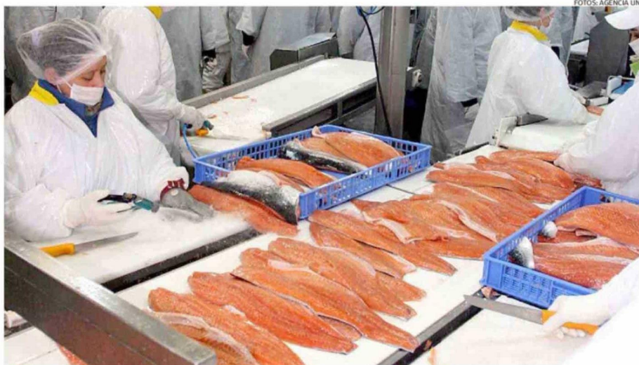
TANTO EN SALMONCHILE COMO EN EL CONSEJO DEL SALMÓN ANALIZAN LAS MEDIDAS A IMPLEMENTAR EN UN FUTURO CERCANO.

De ahí que no sea -asegura- un problema que hoy estén visualizando. Sin embargo, al proyectarlo en los años, se trata de cambios que al país le generarán desafíos que hoy no se