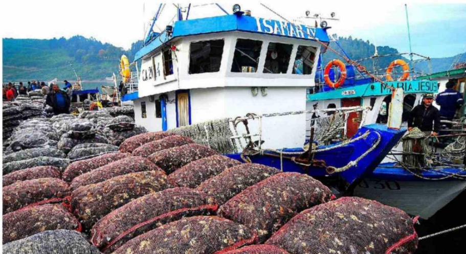
EN LA INDUSTRIA DEL CHORITO NO ADVIERTEN PROBLEMA MAYOR, PERO DE TODOS MODOS LLAMAN A GENERAR MEDIDAS CON TIEMPO.