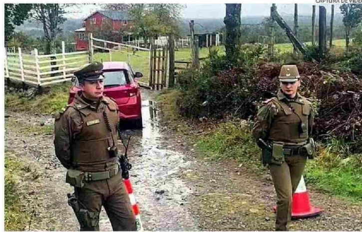
CARABINEROS DE LA CUARTA COMISARÍA CAPTURÓ AYER AL SOSPECHOSO DE FEMICIDIO EN CALBUCO.

“Como Fiscalía, esperamos que el imputado pueda ser puesto a disposición del Juzgado de Letras y Garantía de Calbuco durante la jornada del día sábado 24 de mayo (hoy), en el horario que el tribunal deter-