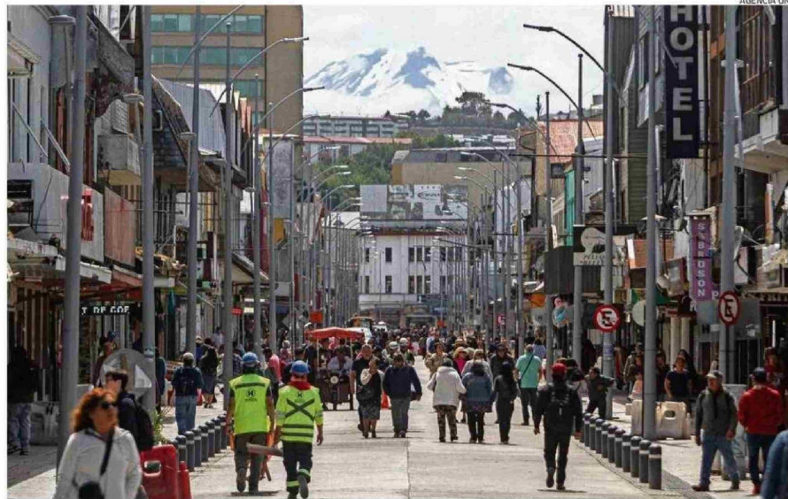
UNA DE LAS ASPIRACIONES DE LA COMUNIDAD PUERTOMONTINA ERA VOLVER A CAMINAR CON TRANQUILIDAD POR EL CENTRO.