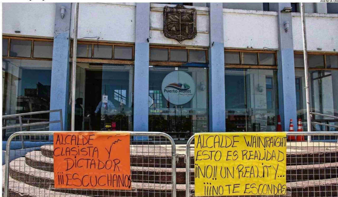
UNA VEZ QUE SE COMENZÓ A APLICAR LA ORDENANZA EN PUERTO MONTT, LOS COMERCIANTES INFORMALES PROTESTARON POR ALGUNOS DÍAS AFUERA DEL MUNICIPIO.

Mientras en Osorno y Puerto Montt parece existir mayor claridad respecto de esta actividad que afecta a los establecimientos que cuentan con permisos y pagan impuestos, la realidad en Castro es más ambigua. Experto advierte los riesgos de la evasión tributaria, la precariedad laboral y el freno a la modernización.