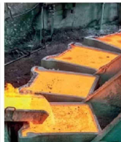
EMPRESAS | Pág. 10 Codelco anota ganancias por más de US$ 2.400 millones en 2025