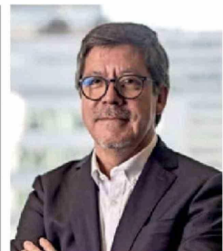
ECONOMÍA | Pág. 7 La "cofradía" de Enap que llegó a la Dirección de Presupuestos