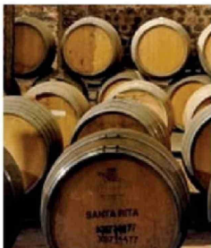
EMPRESAS | Pág. 10 Viña Santa Rita renueva su directorio y ahora no tendrá mujeres