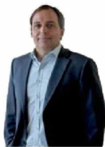
OPINIÓN | Pág. 3 Columna de Matías Acevedo: "Crisis del petróleo: ¿Quién paga la cuenta?"