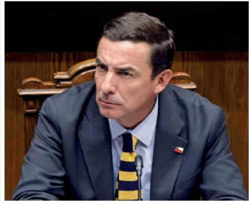
REPORTAJE | Pág. 8 Los litigios empresariales que dejó el ministro de Justicia, Fernando Rabat