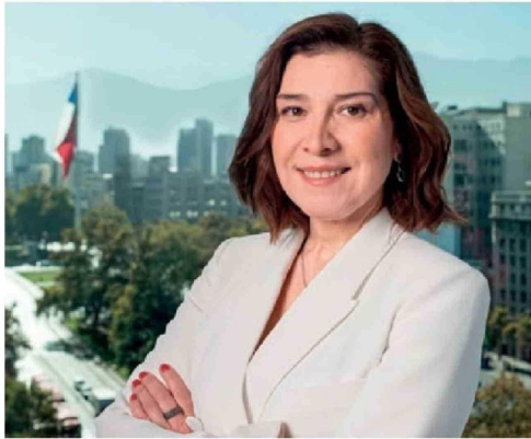
REPORTAJE | Págs. 6-7 Desvinculación de tres altos directivos: las 24 horas que sacudieron a la CMF