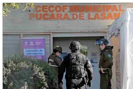
La noche del domingo se registraron incidentes en el Centro Comunitario de Salud Familiar de la Villa Pucará, donde fue trasladado Acevedo.

Carabineros tiene una matriz de riesgo para "evaluar la severidad de escenarios asociados a funerales con potencial de riesgo social". Entre las variables que hay para dicho análisis están "los antecedentes policiales y penales del fallecido, especial-