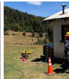
DESDE LA COMPAÑÍA REITERARON EL LLAMADO A LAS FAMILIAS A REGISTRARSE Y COMPROBAR SU SITUACIÓN.

Además, los costos de laboratorio disminuyen de manera significativa, permitiendo que la inversión inicial se recupere en aproximadamente un año, con mejoras sustanciales en precisión, calidad y control de los procesos clínicos.