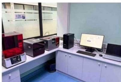
ESTE FLUJO DIGITAL ODONTOLÓGICO, DE ÚLTIMA GENERACIÓN, BENEFICIA INICIALMENTE A LA ESPECIALIDAD DE REHABILITACIÓN ORAL.

Sin embargo, el plan a corto plazo es integrar otras 15 especialidades de odontología, de las cuales ya se han integrado odontopediatría y ortodoncia. Así, con este nuevo sistema, los procesos tradicionales de las áreas podrán reemplazarse por escaneo, diseño e impresión digital, reduciendo significativamente el número de sesiones necesarias de tratamiento por paciente. De manera que, si antes se requería hasta cuatro o más visitas para terminar un tratamiento, ahora puede resolverse en una sola jornada, impactando directamente y positivamente en la comodidad del paciente, especialmente en niños y personas que viven en zonas alejadas.