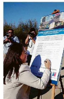
EL TERRENO ES MUNICIPAL.