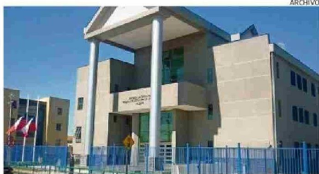
SENTENCIA FUE LEÍDA EN EL TRIBUNAL ORAL EN LO PENAL (TOP) DE VALDIVIA.