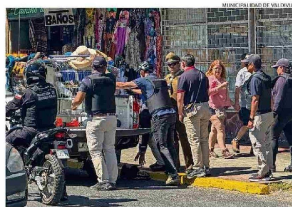
EL TRABAJO SE HA ENFOCADO EN EL CENTRO DE VALDIVIA, ESPECIALMENTE EN EL SECTOR DE LA COSTANERA Y SU EXPLANADA.

De acuerdo a lo informado desde la casa edilicia, estas labores han sido apoyadas por patrullas mixtas, conformadas por inspectores municipales y personal de Carabineros, "for-