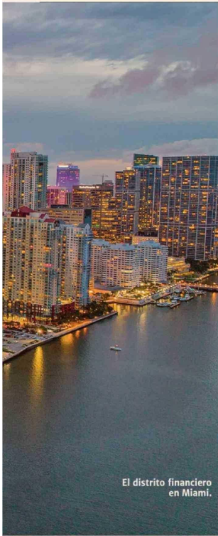
El distrito financiero en Miami.

central para manejar las operaciones con miras de largo plazo”, explicó.