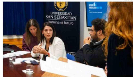
LA PRESENTACIÓN DEL INFORME TUVO LUGAR EN LA SEDE DE LA PATAGONIA (PUERTO MONTT) DE LA UNIVERSIDAD SAN SEBASTIÁN.

demoraría Puerto Varas en agotar su stock de proyectos detenidos, según revela el informe de la USS y Tinsa.