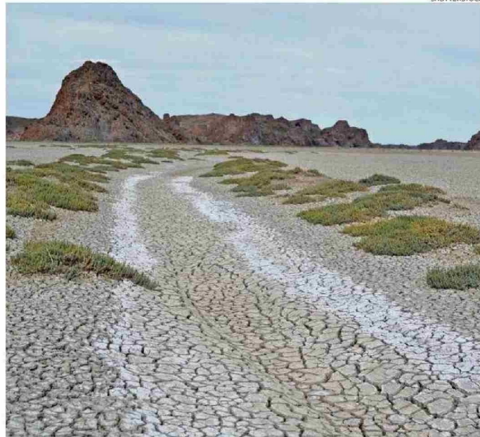
La erosión en la Patagonia argentina ha perjudicado los cultivos.

Sin embargo, “esta agricultura intensiva se ha centrado en la producción y no en la sostenibilidad. Se basa en fertilizantes, pesticidas y monocultivos”, afirmó el docente, lo que “ha llevado a una degradación del suelo, explotación del agua y contaminación del aire”, condu-